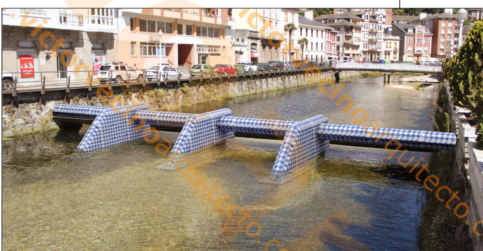
TUBERÍA DEL RIO CON CHAMBRÓN