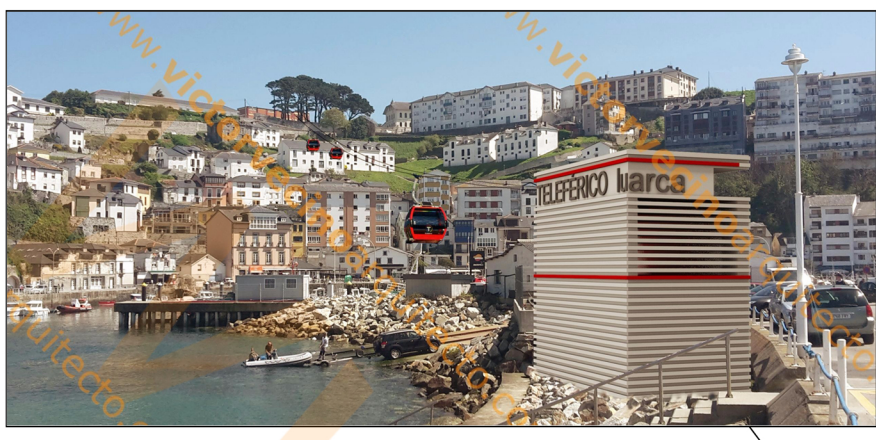
EDIFICIO QUE ALBERGA: -PARADA/SALIDA DE TELEFÉRICO -TIENDA DE SOUVENIRS