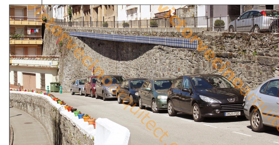
VIGA CON CHAMBRÓN

PROPUESTA RESTRUCTURACIÓN URBANA DE LUARCA (VALDÉS) ASTURIAS