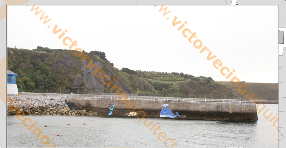
ESPIGÓN MAREA BAJA

MODALIDAD DE VISITA DE CENTROS TURÍSTICOS DE MANERA INDIVIDUAL O MEDIANTE BÓNOS CON AHORRO QUE GARANTICE UNA MAYOR ESTANCIA EN LUARCA. GESTIONADOS A TRAVÉS DEL AYUNTAMIENTO. DIGITALIZADOS. DISPONIBLES EN CADA CENTRO Y OFICINA DE TURISMO CENTRAL. CENTROS VISITALES: -AULA DEL MAR -PARK DE LA VIDA -MUSEO ETNOGRÁFICO -AULA DE INTERPRETACIÓN CASAS DE INDIANOS (VISITA INTERIOR EXTRA) -MUSEO SEVERO OCHOA -JARDINES DEL FONTE BAIXA -TELEFÉRICO