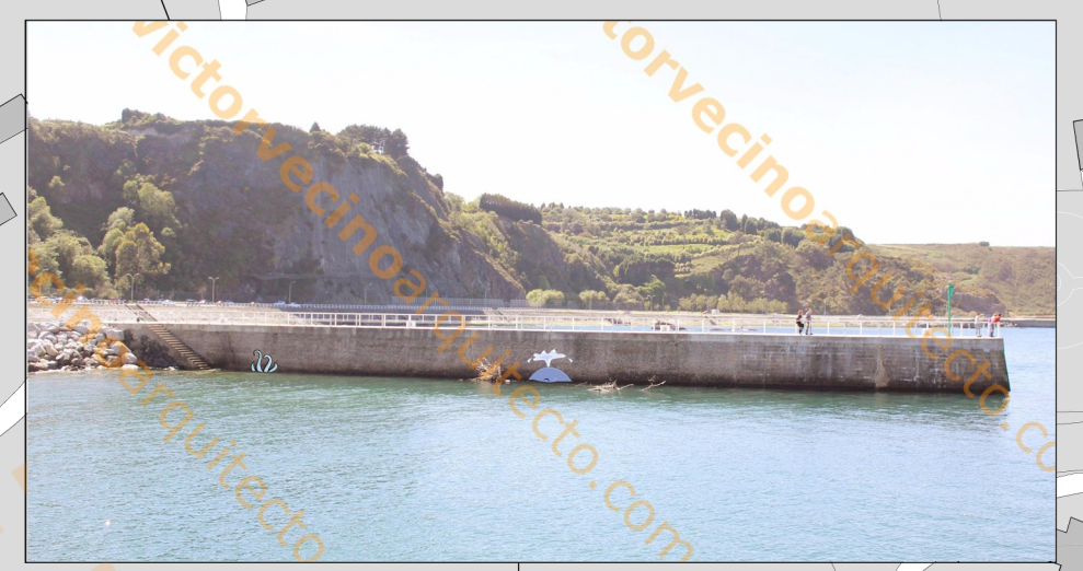
ESPIGÓN MAREA ALTA