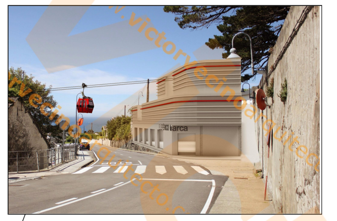
EDIFICIO QUE ALBERGA: -PARADA/SALIDA DE TELEFÉRICO -CENTRO RECEPCIÓN DEL PEREGRINO -AULA DE INTERPRETACIÓN CASAS INDIANAS -CAFETERÍA RESTAURANTE