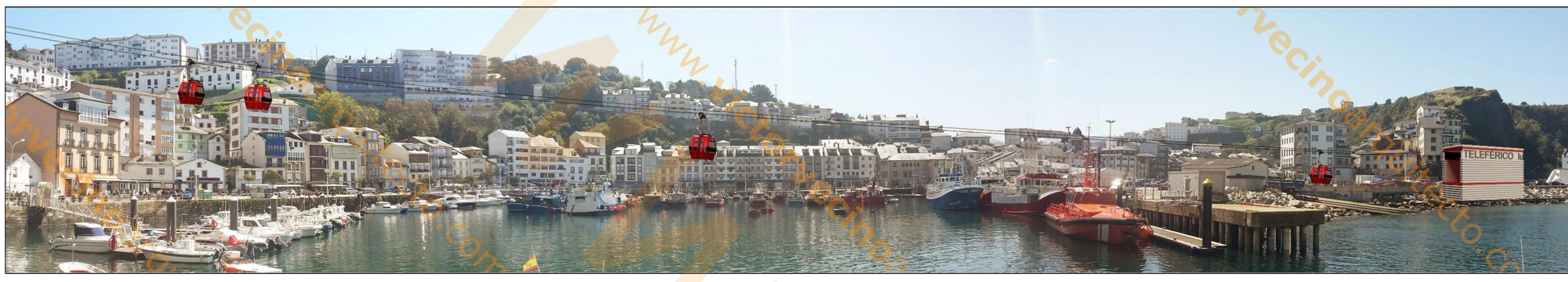
RECORRIDO DEL TELEFÉRICO PARA USO TURÍSTICO Y DIARIO. CAPACIDAD 6 PERSONAS. TARIFAS REDUCIDAS PARA RESIDENTES